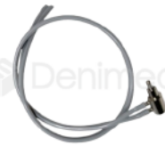
R-B 008 VÁLVULA PARA SOPORTE MODELO DCI DABI ATLANTE