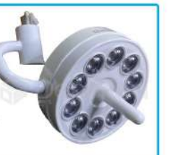
R-G 022 Lámpara 10 Led 50.000W