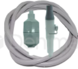
R-B 039 MANGUERA DE SUCCIÓN CON REGULACIÓN CON FILTRO DABI GNATUS