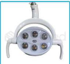
R-G 023 Lámpara 6 Led 35.000W