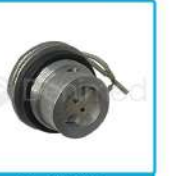
R-G 033 Soquete Lámpara Denimed