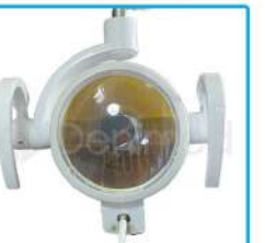
R-G 016 Lámpara Switch Halógena