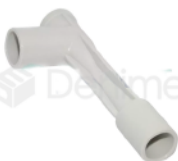
R-B 049 TUBO SUCCIÓN SUPER VENTURI ESCUPIDERA GNATUS DABI 700