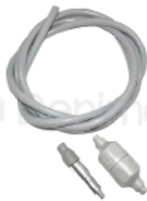
R-B 038 MANGUERA CON SUCCIÓN CON FILTRO DABI GNATUS