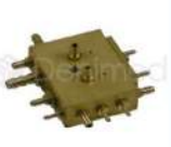
R-K 008 Distribuidores