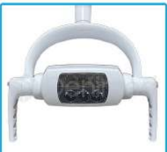
R-G 012A Lámpara 6 Led