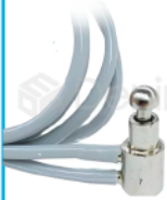
R-B 013 VÁLVULA PILOTO PARA EQUIPO (SOPORTE DE MÓDULO) TECHNO/VERSÁTIL /D700