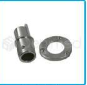
R-G 011 Porta Lámpara