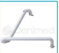
R-G 025 Brazo Tijera Lámpara