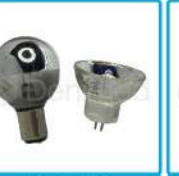
R-G 032 Ampolleta Lámpara de Pabellón