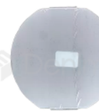
R-B 029 LAMINA CUBRE FOCO DABI ATLANTE VERSA