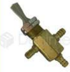
R-K 030 Válvula de Intercambio de Agua