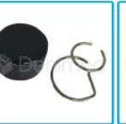
R-G 007 Sombrero Tapa