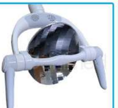
R-G 020 Lámpara Led Dicroico 30.000W