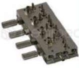
R-K 002 Block Neumático x4