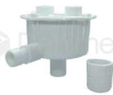
R-B 031 CAJA DE DESAGUE CON ACOPLÉ GNATUS SAEVO