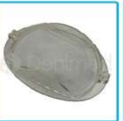
R-G 004 Cubre Foco Ovalado