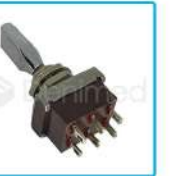
R-G 008 Micro Switch Lámpara