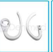
R-G 006 Manillas De Foco