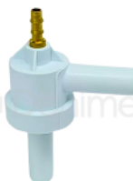
R-B 050 VALVULA SUCTORA INYECTOR MONTADO KAVO