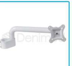
R-G 026 Brazo Monitor Ajustable