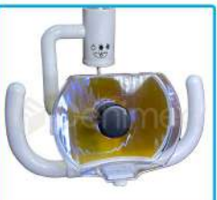
R-G 018 Lámpara Ovalada Halógena