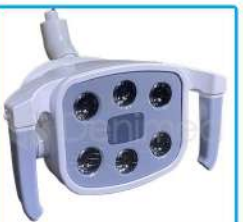
R-G 019 Lámpara 6 Led 35.000W