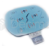
R-B 041 MEMBRANA PANEL DE CONTROL UNIDAD 200 DABI