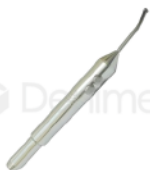
R-B 026 JERINGA TRIPLE RECTA PARA KAVO UNI./AM TEAM