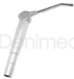
R-B 037 JERINGA TRIPLE CUADRADA CON ENCAJE UNIVERSAL