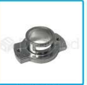
R-G 029 Soporte de Lámpara