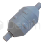
R-B 028 FILTRO SEPARADOR DE RESTOS PARA UNIDAD DABI/GNATUS