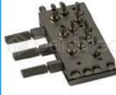
R-K 003 Block Neumático x3