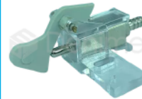
R-B 017 SOPORTE VÁLVULA PILOTO METÁLICO MOD GNATUS