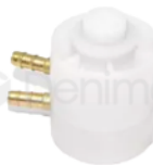
R-B 021 VÁLVULA NEUMÁTICA DE PEDAL PROGRESIVO MOD KAVO