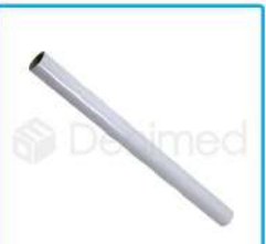
R-G 024 Brazo Pilar Lámpara