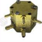
R-K 015 Válvula Novo 5 de Salidas