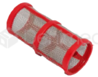
R-B 036 FILTRO BOMBA DE VACÍO 3/4 DABI GNATUS SAEVO