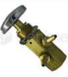
R-K 052 Válvula de Soplado