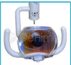
R-G 017 Lámpara Ovalada Halógena