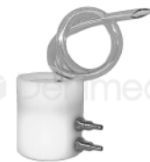
R-B 045 TAPA DEL DEPÓSITO DE AGUA DENTAL