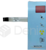
R-B 040 MEMBRANA DE CONTROL RAYOS X DABI ATLANTE