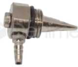
R-B 032 VALVULA DE AIRE VENTURI GNATUS DABI D700