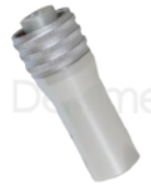
R-B 006 TERMINAL BORDEN BAJA ROTACIÓN GNATUS