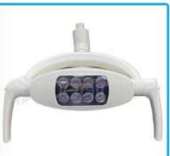
R-G 012B Lámpara 8 Led