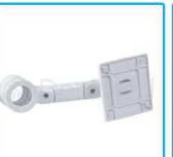
R-G 027 Brazo Monitor Ajustable