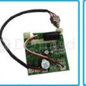
R-G 031 Tarjeta de Lámpara Led