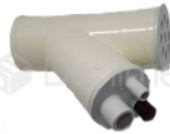
R-B 034 CONECTOR DE DESCARGA KAVO