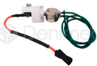
R-B 019 VÁLVULA ELECTRO NEUMÁTICA COMPLETA PARA SUCCION MODELO AP (DABI)