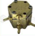
R-K 014 Válvula Novo 4 de Salidas