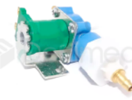
R-B 022 VÁLVULA SOLENOIDE 24 UNIDAD/ESCUPIDERA DABI/SAEVO