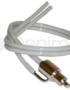
R-B 009 VÁLVULA PARA SOPORTE PUNTA BLANCA MOD. DABI