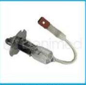
R-G 010 Ampolleta 12x55 H3