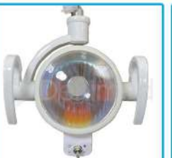
R-G 015 Lámpara Switch Halógena