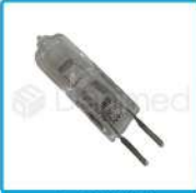
R-G 009 Ampolleta 12x50 W