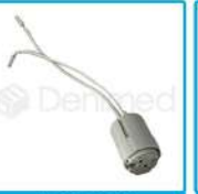
R-G 030 Soporte de Lámpara