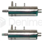
R-B 014 VÁLVULA NEUMÁTICA PARA EQUIPOS MODELO ORIGINAL