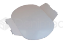
R-B 030 LAMINA CUBRE FOCO DABI ATLANTE REFLEX LD