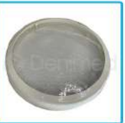
R-G 003 Cubre Foco Redondo