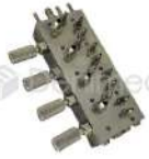
R-K 001 Block Neumático x4