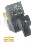
R-B 035 DESPICHE AUTOMÁTICO PARA COMPRESOR 127V CON ACOPLÉ