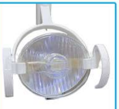
R-G 013 Lámpara Sensor Halógena