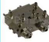
R-K 006 Distribuidor Aire-Agua