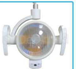
R-G 014 Lámpara Sensor Halógena