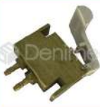
R-K 050 Micro Switch Neumático N/O