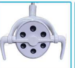
R-G 021 Lámpara 6 Led