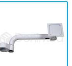
R-G 028 Brazo Monitor Ajustable