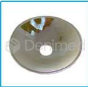
R-G 001 Dicroico Redondo