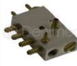
R-K 005 Distribuidores