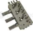
R-K 004 Block Neumático x3