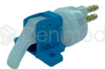
R-B 024 VÁLVULA COMANDO SUPORTE KAVO