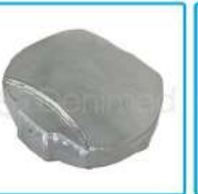
R-G 005 Carcasa de Foco