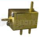
R-K 018 Válvula Novo