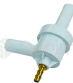
R-B 023 VÁLVULA SUCTORA / INYECTOR MONTADO KAVO