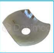
R-G 002 Dicroico Ovalado