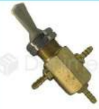
R-K 031 Válvula de Intercambio de Agua