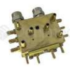
R-K 007 Distribuidor Aire-Agua